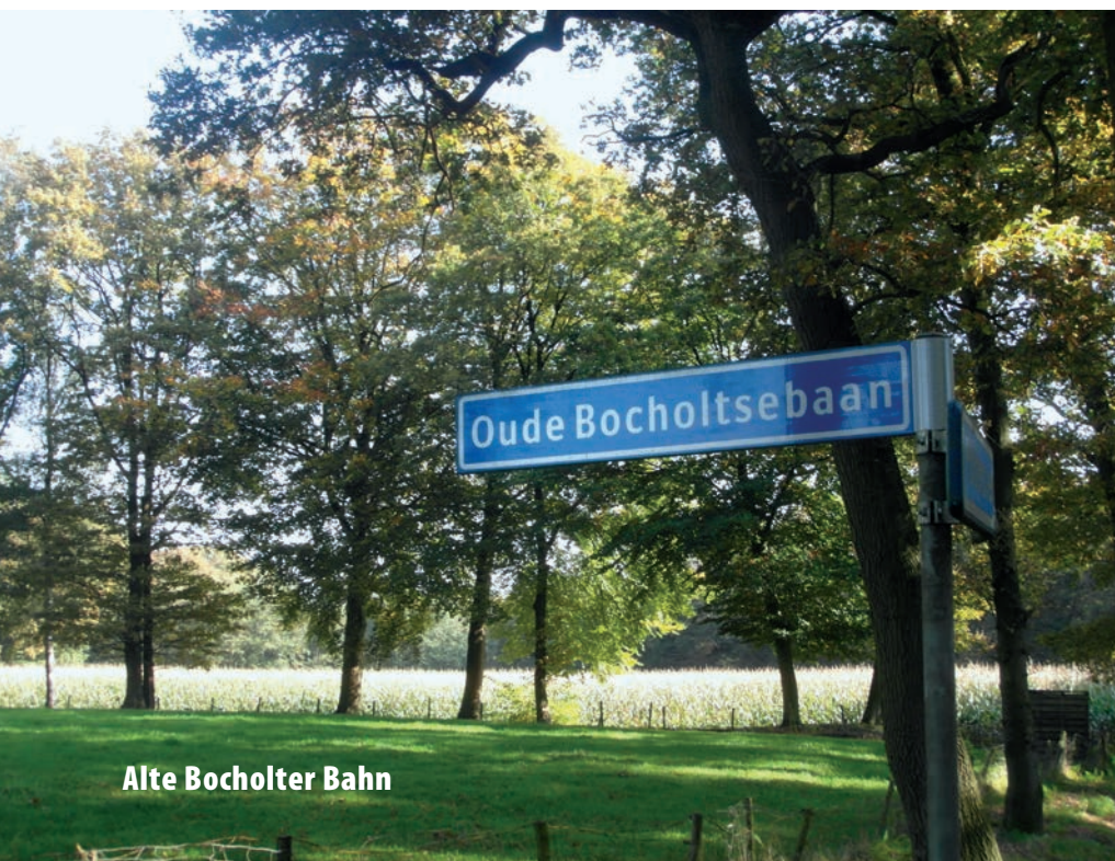
Alte Bocholter Bahn