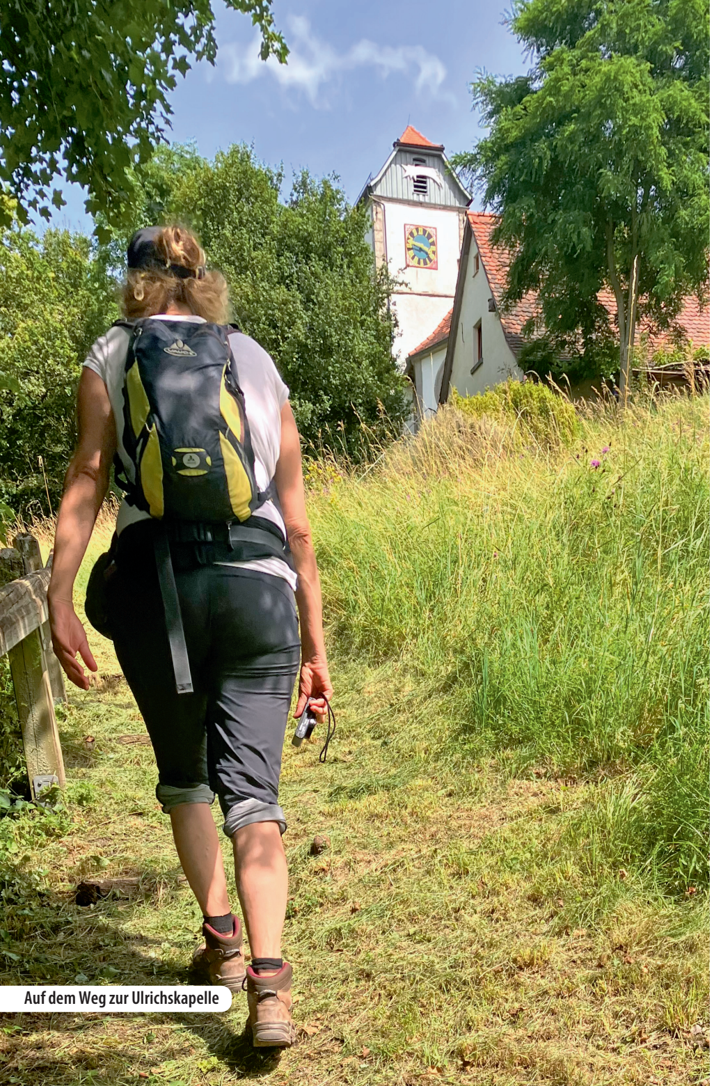
Auf dem Weg zur Ulrichskapelle