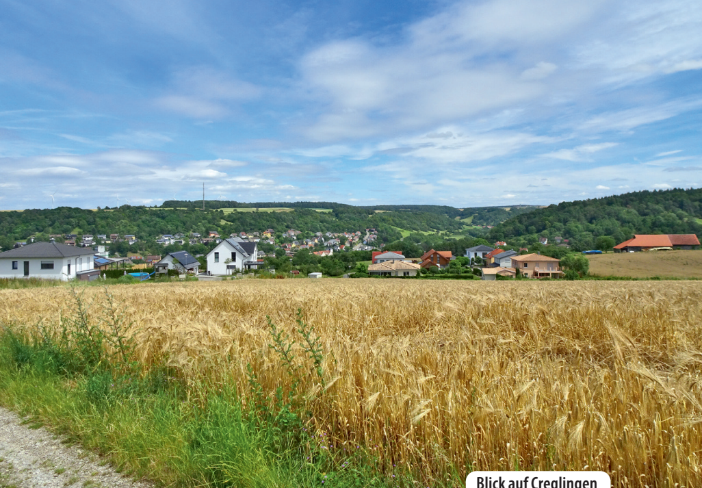
Blick auf Creglingen

13. Jahrhundert entstammt. Die Torstraße führt uns rechts weiter und beim Gasthaus Grüner Baum biegen wir links ab. Der Anstieg fordert etwas unseren Kreislauf. Bald kommen wir so richtig in Schwung, während wir der Streichentaler Straße folgen. Kurz vor dem Ortsschild wenden wir uns rechts dem Schafgärtenweg zu und gehen nun in Richtung Wald.