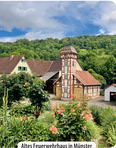
Altes Feuerwehrhaus in Münster

nach dem Abzweig Hörle schon bald halb links ab und können wieder entspannt auf dem Wanderweg flanieren. Oberhalb des Eppichstals haben wir nicht nur einen schönen Blick, sondern wandern jetzt talwärts und erfreuen uns an der Aussicht über die Dächer von Münster. Ein Dorfgockel begrüßt uns bereits von Weitem.